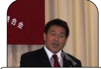
第2回資質向上講座 講師 野球評論家 広澤 克実 氏